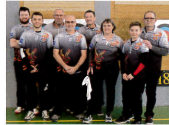
Photo ci-dessous : tir au boudin à Noyon le 6 mars qui a permis à la compagnie de réaliser une belle collecte et avec un jeune archer ainsi qu'un adulte qui ont participé à leur 1er concours.

Les 2 autres photos : tir au brie et aux bonbons organisé par la compagnie de Vaumoise le 19 mars avec 4 jeunes qui participaient à leur premier concours avec là encore une belle collecte de brie et de bonbons. La compagnie d'arc d'Haramont est très fière de tous ces bons résultats.